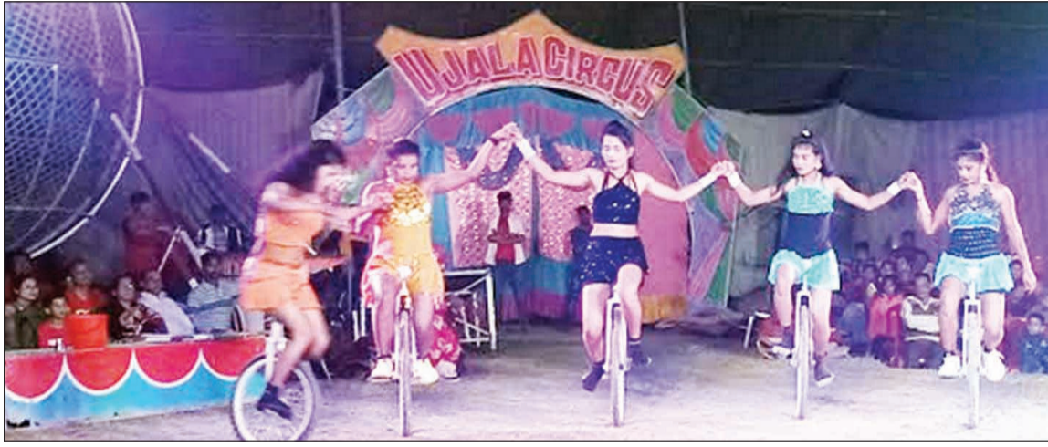
हावड़ा जिले के स्लप इलाके में उजाला सर्कस अपने 3 शो लेकर एक महीने के लिए हाजिर है, सर्कस देखने काफी संख्या में पहुंच रहे हैं लोग, जिसका एक दृश्य। विधिवत उद्घाटन किये डोमजूर के विधायक व तृणमूल हावड़ा जिला के अध्यक्ष कल्याण घोष।